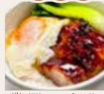
超熟ローストポーク丼 叉燒煎蛋飯 BBQ Pork and Egg on Rice ¥1,280 (税込)