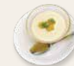
定番絶品マンゴープリン 芒果布甸 Mango Pudding ¥630 (税込)