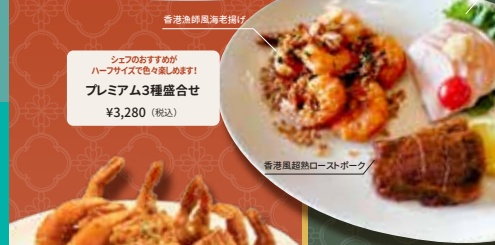
香港漁師風海老揚げ 避風塘大蝦 Typhoon Shelter Chili Garlic Fried Shrimp 大皿料理 (2~4人前) ¥3,980 (税込)