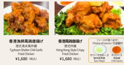
香港漁師風鶏唐揚げ 港式油夫風炸雞 Typhoon Shelter Chili Garlic Fried Chicken ¥1,680 (税込)