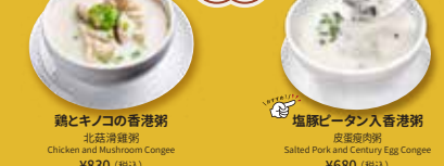
鶏とキノコの香港粥 北菇滑雞粥 Chicken and Mushroom Congee ¥830 (税込)