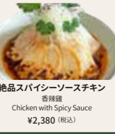
絶品スパイシーソースチキン 香滑雞 Chicken with Spicy Sauce ¥2,380 (税込)