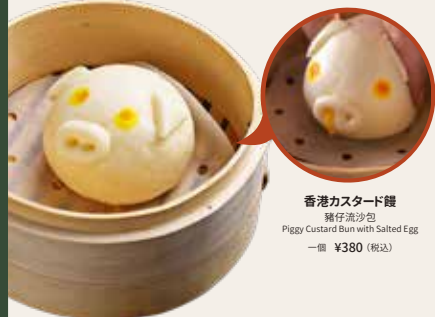
香港カスタード饅 猪仔流沙包 Piggy Custard Bun with Salted Egg 一個 ¥380 (税込)

子豚の顔のカスタード饅頭は DimDimSum (貼點心) の名物デザートです。ふわふわの生地の中にとろ〜りカスタードが入っています。フィリングはアールの卵黄を使った甘いカスタードです。豚の鼻にお骨で穴をあけて、ほっぺをぎゅ〜と押すと熱々のカスタードがとろ〜りと流れ出します。ぜひチャレンジしてみてください! Dim Dim Sum's Piggy Custard Bun is a soft and fluffy bun filled to the brim with a melty, gooey custard. The filling is a combination of sweet custard and salted duck egg yolk, which gives it a "sweet-salty" taste that everyone will love. We encourage you to play with your food! With a chopstick, poke holes in the pig's nostrils. When you lightly squeeze its cheeks, the hot lava-like custard will flow out. Only!