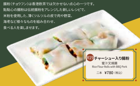
R19 チャーシュー入り腸粉 豉汁叉燒腸粉 Rice Flour Rolls with BBQ Pork 二本 ¥780 (税込)