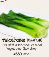
季節の茹で野菜 (ちんげん菜) 皮蛋滑粥 Blanched Seasonal Vegetables (bok choy) ¥680 (税込)