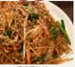
香港風炒麵 港式炒麵 Hong Kong Style Fried Noodles ¥1,280 (税込)