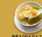
海老入りわんたんスープ 鮮蝦雲吞 Shrimp Wontons in Soup ¥780 (税込)