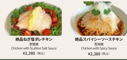
絶品ねぎ塩ダレチキン 香滑雞 Chicken with Scallion Salt Sauce ¥2,380 (税込)

(ソースが選べます) Choice of sauce(s) / 可選醬料 ソースマヨネーズ / 炸醬 Sour Mayo チリソース / 辣醬 Chili Sauce