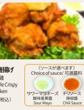
香港風鶏唐揚げ 港式炸雞 Hong Kong Style Crispy Fried Chicken ¥1,680 (税込)

(ソースが選べます) Choice of sauce(s) / 可選醬料 ソースマヨネーズ / 炸醬 Sour Mayo チリソース / 辣醬 Chili Sauce