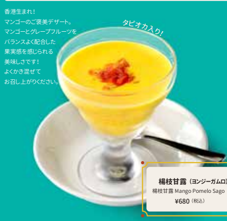
楊枝甘露 (マンゴーガムロ) 楊枝甘露 / Mango Pomelo Sago ¥680 (税込)