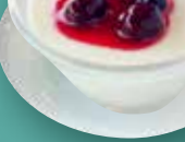
とろけるライチプリン 荔枝布甸 Lychee Pudding ¥480 (税込)