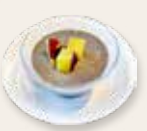
濃厚黒胡麻プリン 黑芝麻布甸 Rich black sesame pudding ¥580 (税込)