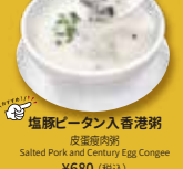
塩豚ピータン入香港粥 皮蛋滑粥 Salted Pork and Century Egg Congee ¥680 (税込)