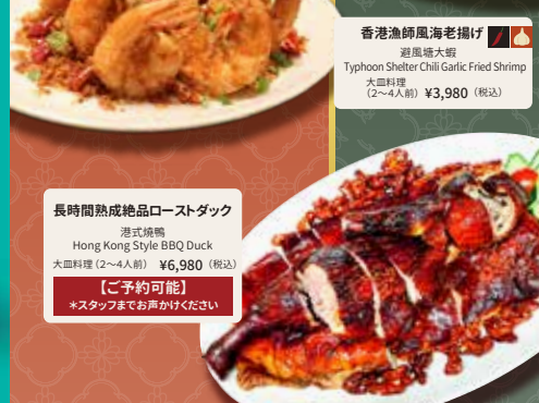
長時間熟成絶品ローストダック 港式燒鴨 Hong Kong Style BBQ Duck 大皿料理 (2~4人前) ¥6,980 (税込)