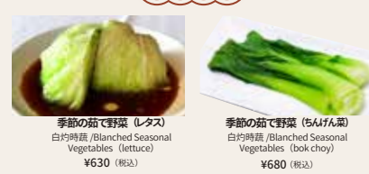
季節の茹で野菜 (レタス) 北菇滑雞粥 Blanched Seasonal Vegetables (lettuce) ¥630 (税込)