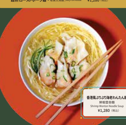
香港風ふりかけ海老わんたん麺 鮮蝦雲吞麵 Shrimp Wonton Noodle Soup ¥1,280 (税込)