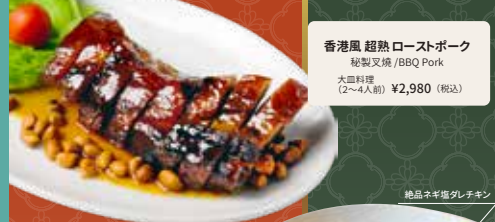
香港風 超熟ローストポーク 秘製叉燒 / BBQ Pork 大皿料理 (2~4人前) ¥2,980 (税込)