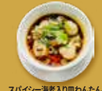
スパイシー海老入りわんたん 紅油抄手 Spicy Shrimp and Mushroom Wontons ¥830 (税込)